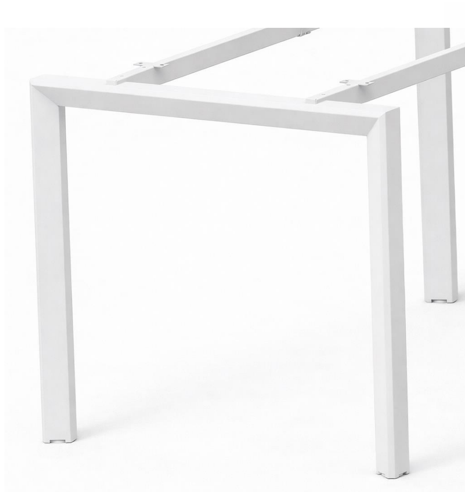
MELAMINA DISPONIBLE - ESTACIÓN DE TRABAJO