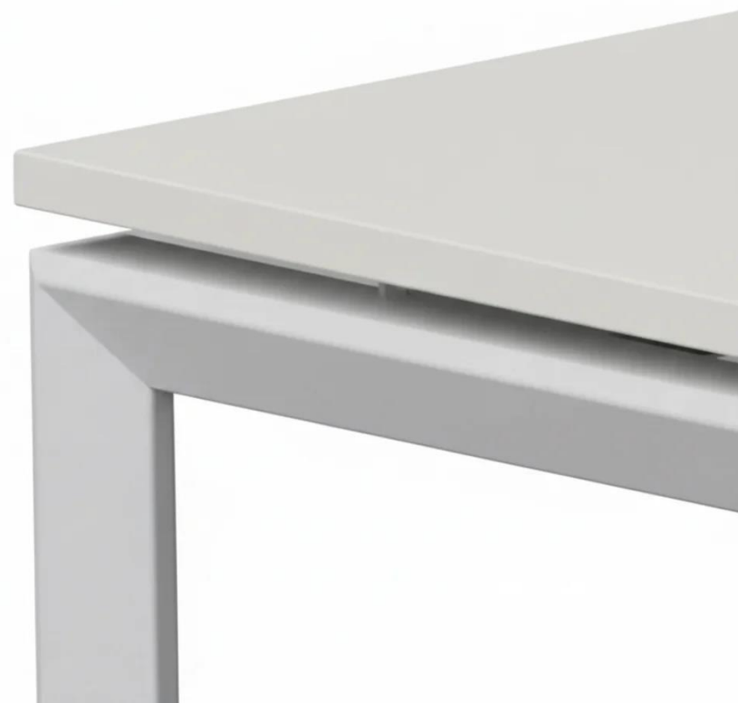
colores estructura metálica.