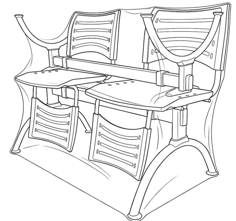
Apilable de a 2 unidades. Peso y dimensiones varía según la cantidad de cuerpos.