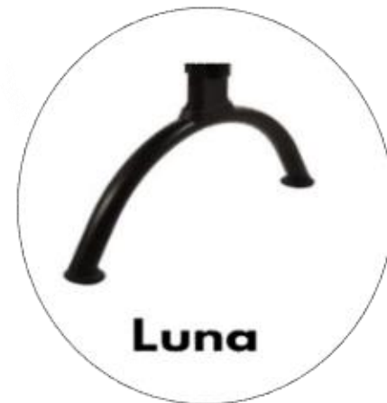
Medidas Según Cuerpos