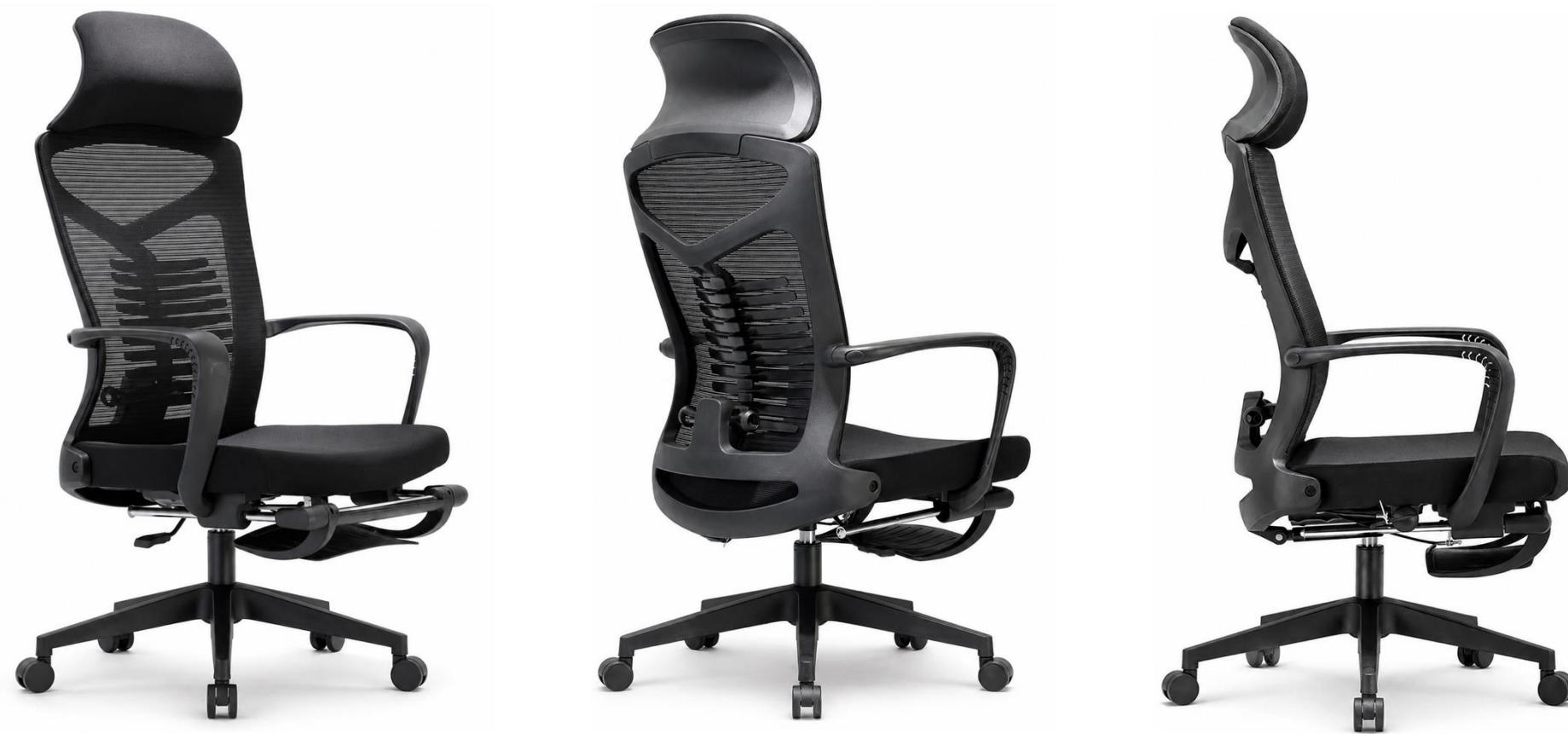
SILLA EJECUTIVA OPUS