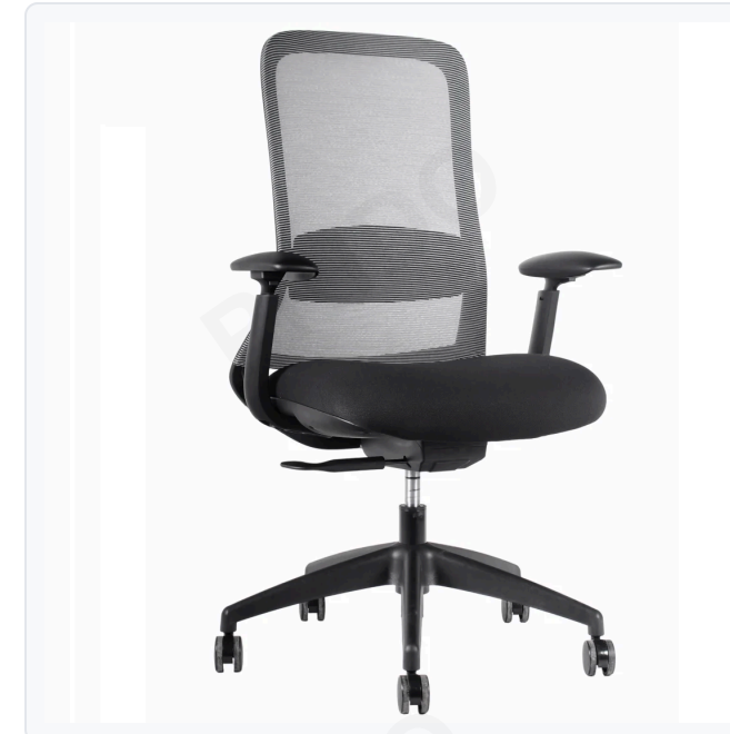
● GRIS K-MHE-10002