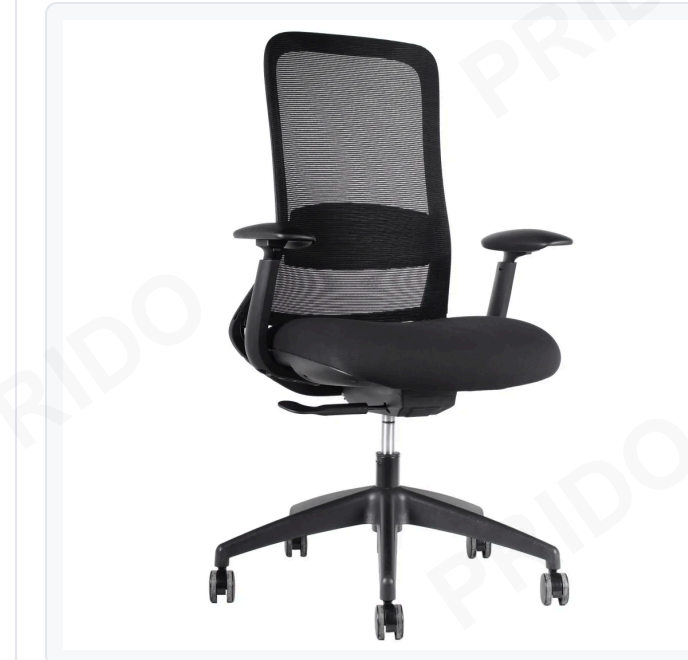
● NEGRO K-MHE-10001